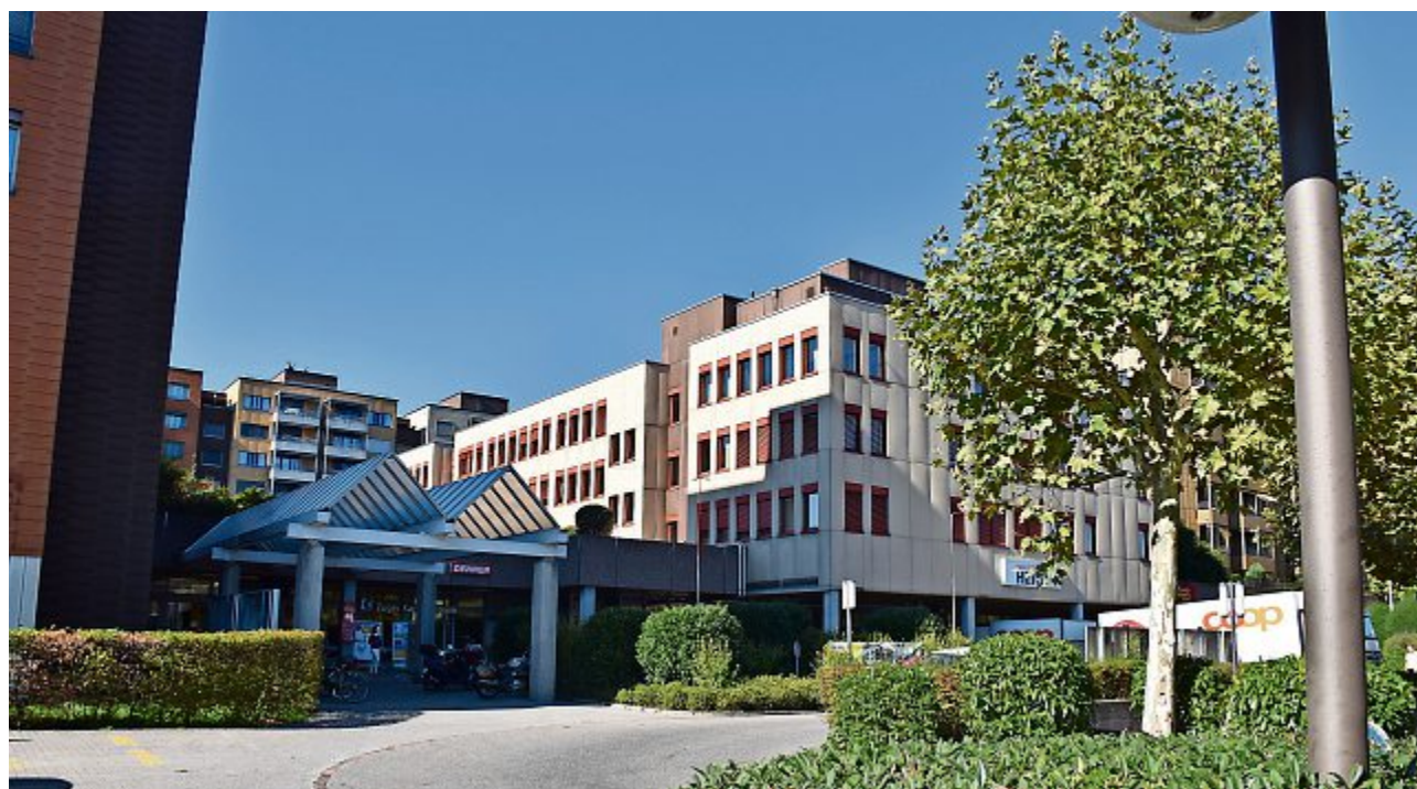
Das Regionale Arbeitsvermittlungszentrum des Kantons Zug macht grundsätzlich sehr gute Arbeit, aber...

Bei unseren tiefgreifenden Recherchen erfuhren wir, dass viele RAV-Klienten mit der Beratung aus unterschiedlichen Gründen nicht zufrieden sind. Unsere Informanten baten uns, sie nicht namentlich zu erwähnen, da sie sich vor mögli-