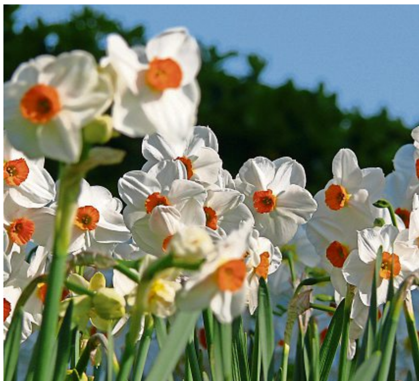
Die Osterglocken sind typische Frühjahrsblumen.

Nicht ausser acht zu lassen ist, dass besonders viele Frühjahrsblumen im Wald blühen, solange die Bäume in Laub- und Mischwäldern noch nicht mit Laubblättern bedeckt sind und die Strahlen der Sonne den Waldboden erreichen. Ab wann, welche Blumen im Frühjahr zu blühen beginnen und ihre Farbenpracht zeigen, hängt immer auch vom Winterverlauf ab und ob ein milder Frühling bis zum Mai stabil bleibt und nicht kurzzeitig der Winter wieder zurückkehrt. PD/CI (Quelle: garten-treffpunkt.de )