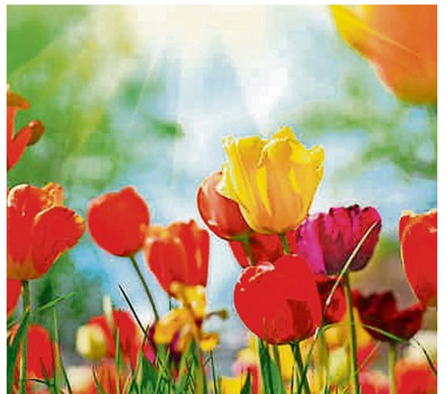
Die Tulpen wachsen bereits im März wieder.