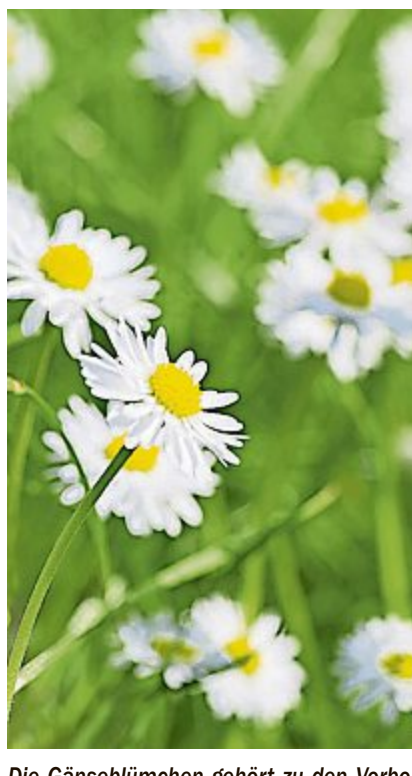
Die Gänseblümchen gehört zu den Vorboten des Lenzes.