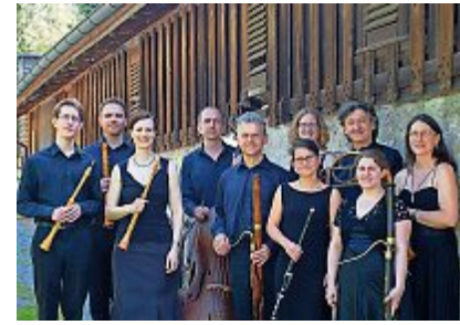
Am 19. Mai geben die Kammer Solisten aus Zug in der Kirche Maria Opferung ihr Können zum Besten. z.Vg.

■ Hagendorn, Ziegelei-Museum, 13 bis 17 Uhr: Internationaler Museumstag. Mehr Infos unter: www.ziegelei-museum.ch .