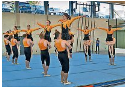
Am Samstag, dem 18. Mai, wird in Menzingen der traditionelle Moränen Cup durchgeführt.